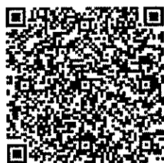
お申し込み QR コード